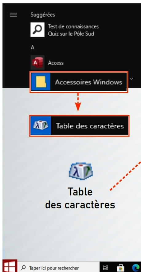
Table des caractères