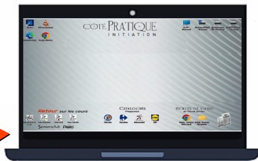
Bureau Côté PRATIQUE

Lors du cours précédent, nous avons créé un NOUVEAU Bureau . Il nous servira à réaliser différents exercices, tout au long de la session.